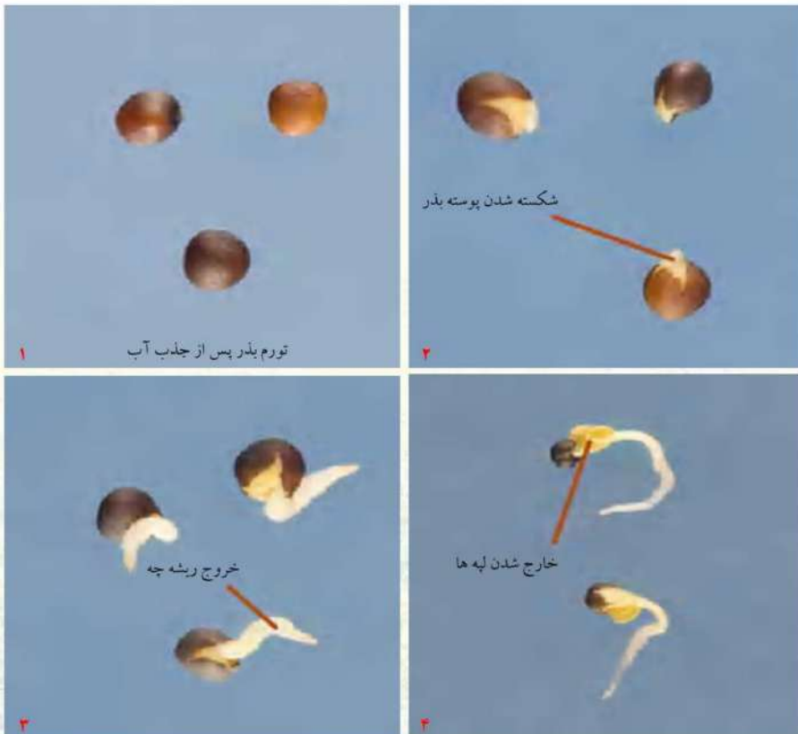
مراحل جوانه زنی بذر کلزا